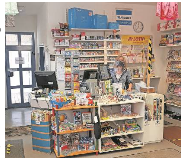
Hier gibt es alles fürs Baby

Im Grunde geht in Petra's Babyworld in der Jettinger Straße 6/1 in Kuppingen auch zu Pandemiezeiten alles seinen gewohnten Gang. Der Hermes-Paketshop und Service-Point der regional und national vernetzten BW-Post haben geöffnet, müssen Kleidungsstücke in die Reinigung, gibt man sie her. Tippscheine können an der Toto-Lotto-Annahmestelle abgegeben werden, man deckt sich ein mit Lese- und Zeitschriften (Fernsehprogramm, Garten, Basteln, Kinder), kauft Tabakwaren ebenso wie Wolle und Nähzubehör sowie Schreibwaren für den (Homeschooling-)Schulbedarf. Ob sich nun zwei, vier oder wie viele Kunden auch immer