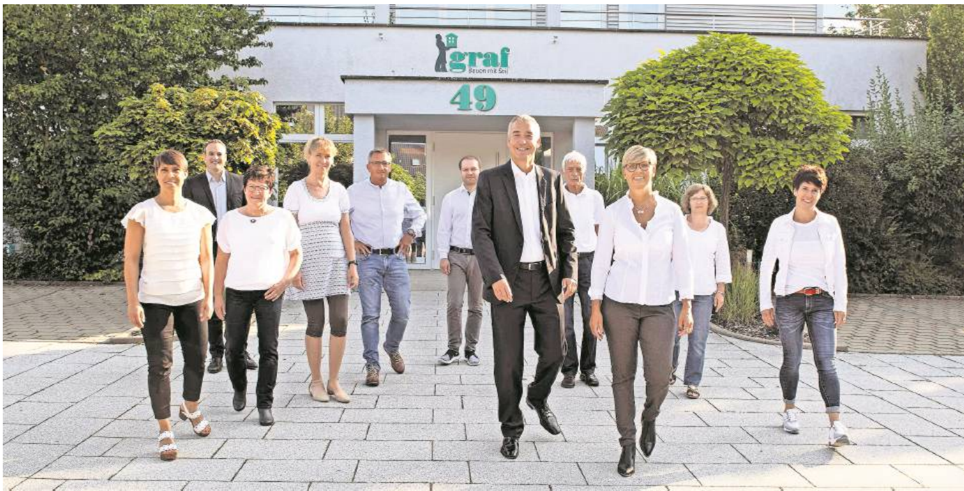
Das Team von Graf Wohnbau vor dem Firmengebäude in Kuppingen